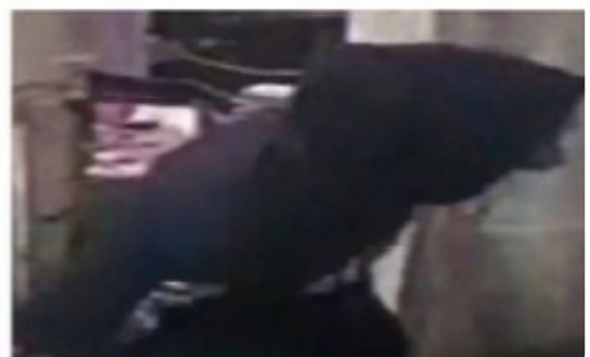
Aksi Pelaku Pencurian Terekam CCTV

SIMALUNGUN-PEMATANG SIANTAR - Seorang ibu rumah tangga warga jalan Cempaka I, Kecamatan Siantar, Kabupaten Simalungun telah melaporkan peristiwa pencurian yang ia alami, menimbulkan kerugian diperkirakan senilai Rp 5 jutaan.